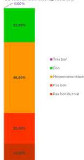
Le moral des entrepreneurs

de compenser la perte de chiffre d'affaires liée aux intempéries. En outre, près d'une entreprise sur deux observe une hausse des impayés depuis trois mois.